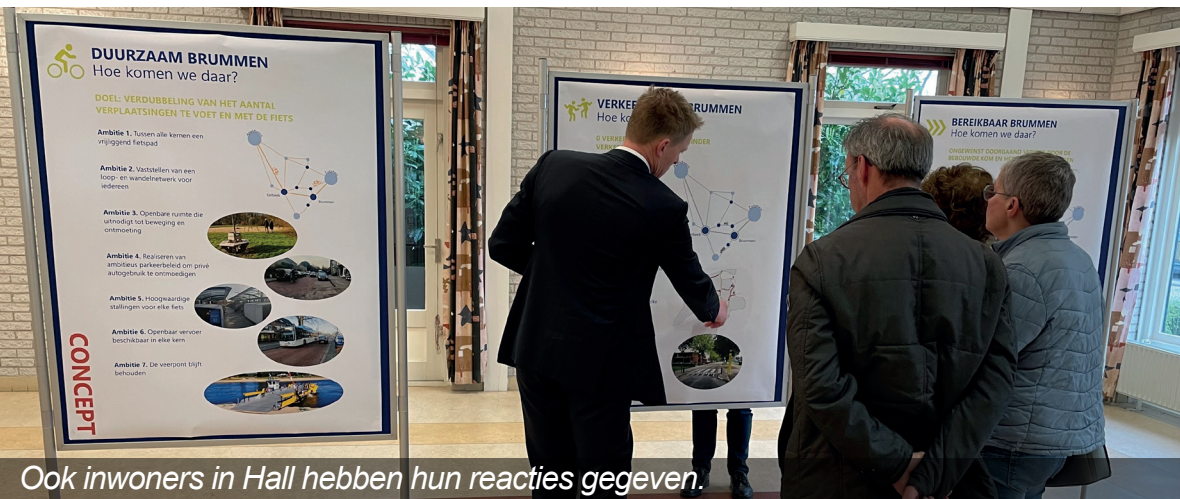
Ook inwoners in Hall hebben hun reacties gegeven.

Tot slot wil het college de bereikbaarheid op peil houden. Om dit alles ook echt waar te maken staan in de visie 18 concrete ambities en 4 opgaven. Uiteindelijk wordt er ook een uitvoeringsplan opgesteld.