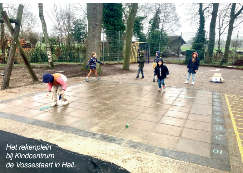
Het rekenplein bij Kindcentrum de Vossestaart in Hall