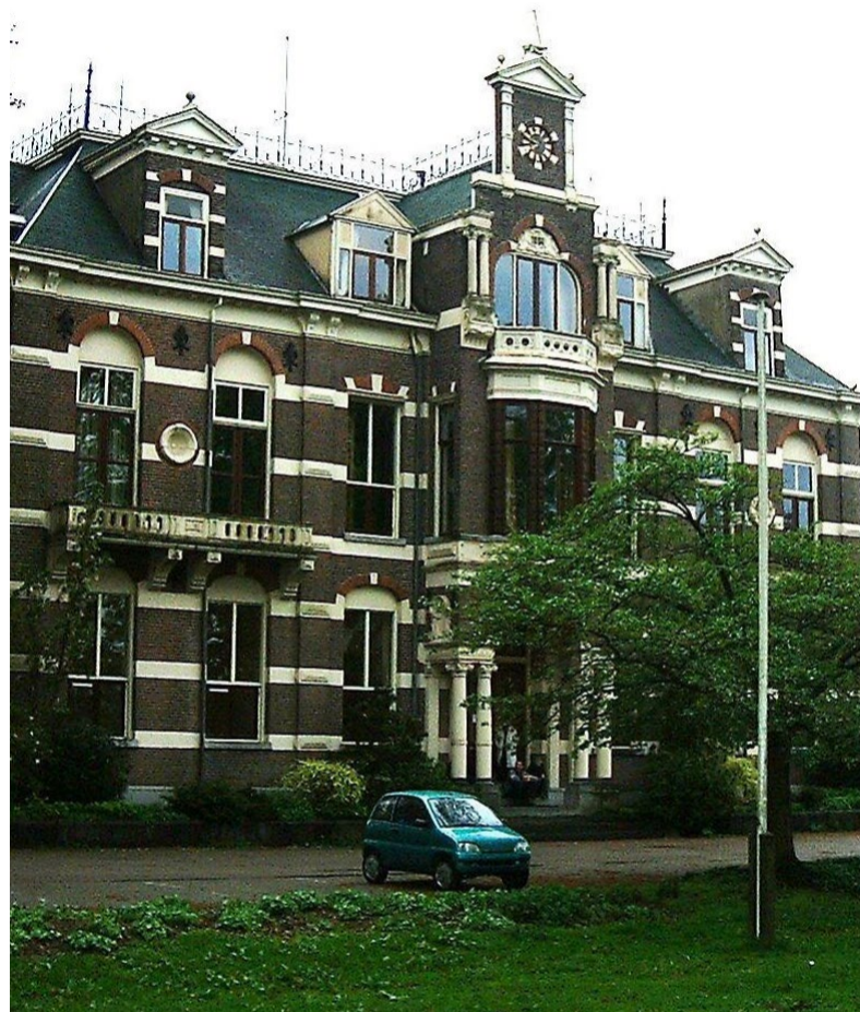
De Michaelshoeve in Brummen

De gemeente Brummen gaat tijdelijk de aan de gemeente toegewezen statushouders huisvesten in een paviljoen op het terrein van de Michaelshoeve in Brummen. Hiermee probeert de gemeente een inhaalslag te maken om te voldoen aan de wettelijke taakstelling om deze nieuwe Nederlanders in onze gemeente onderdak te bieden. Met de eigenaar van het pand is afgesproken dat de gemeente een paviljoen voor een periode van 2 jaar huurt. Ook is de eigenaar in gesprek met het Centraal Orgaan opvang Asielzoekers (COA) over verkoop van het terrein. Dit met de intentie om hier op termijn voor een langere periode vluchtelingen op te vangen. Het gaat dan om personen waarvoor de procedure nog loopt. Over beide ontwikkelingen worden aanwonenden en andere belangstellenden eind deze week via een informatieavond bijgepraat.