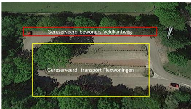
Gereserveerde parkeerplekken tijdens transport

In de vorige nieuwsbrief hebben we al een planning gegeven van de komende werkzaamheden. Deze planning geldt nog steeds. Concreet betekent dit dat eind deze week de eerste 8 woningen in Eerbeek arriveren. Op donderdag 16 maart worden de eerste woningen geplaatst. Het speciale nachtelijke transport is in de nacht van woensdag 15 op donderdag 16 maart en ook van donderdag 16 op vrijdag 17 maart. Deze woningen worden dan donderdag en vrijdag op het terrein geplaatst. Vermoedelijk twee weken later volgen de 8 andere woningen. Op deze transportdagen geldt een verkeersbesluit (namelijk een parkeerverbod aan de Veldkantweg en op het parkeerterrein bij sportpark De Veldkant). Overigens is op dit parkeerterrein wel een strook gereserveerd voor auto's van bewoners aan de Veldkantweg.