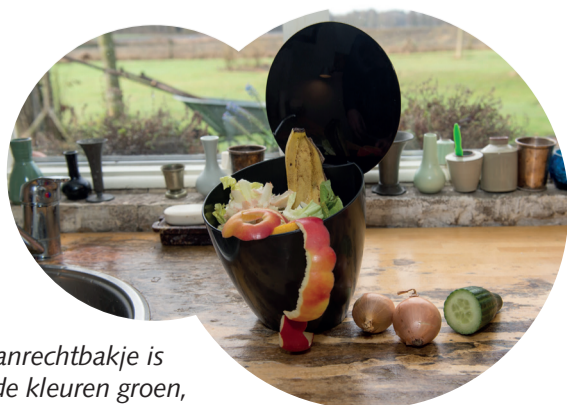
Het aanrechtbakje is er in de kleuren groen, blauw en zwart.

Circulus organiseert in opdracht van de gemeente Brummen een uitdeelactie met handige aanrechtbakjes. Dat gebeurt dinsdagmiddag 12 september op de markt in Eerbeek en dinsdagochtend 19 september op de markt in Brummen. De aanrechtbakjes helpen om schillen en etensresten apart te houden voor de groene container. Dat zorgt voor minder restafval.