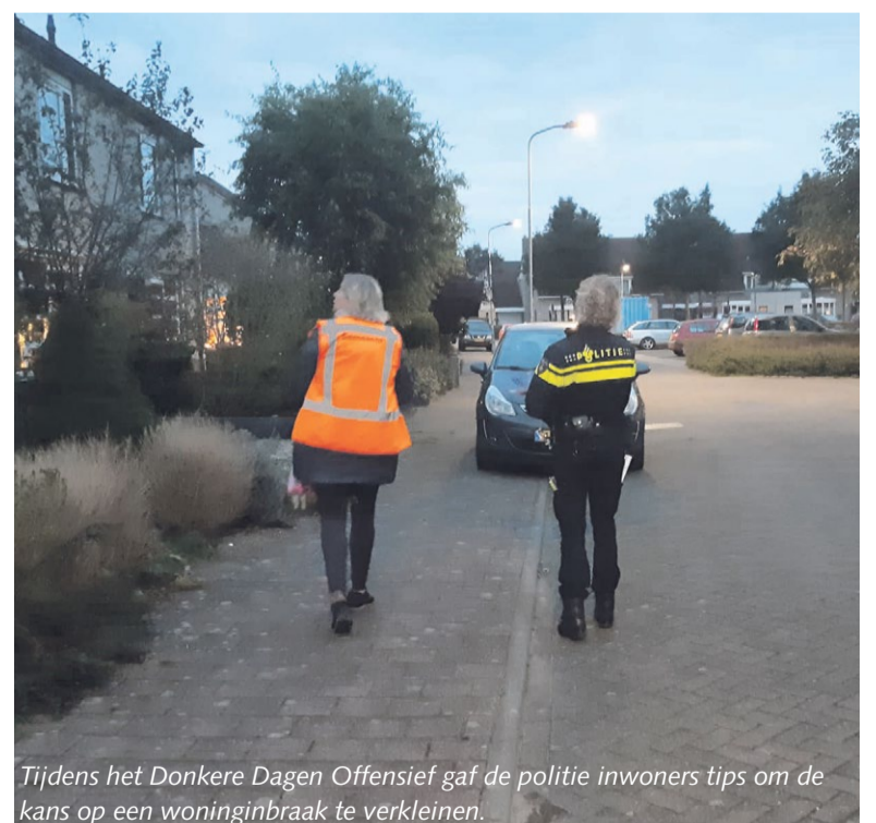
Tijdens het Donkere Dagen Offensief gaf de politie inwoners tips om de kans op een woninginbraak te verkleinen.

MMA is zeven dagen per week bereikbaar via 0800-7000. Op maandag tot en met vrijdag van 8.00 tot 22.00 uur en in weekenden en op feestdagen van 9.00 tot 17.00 uur. Daarnaast kan je 24/7 melden via meldmisdaadanoniem.nl/melden