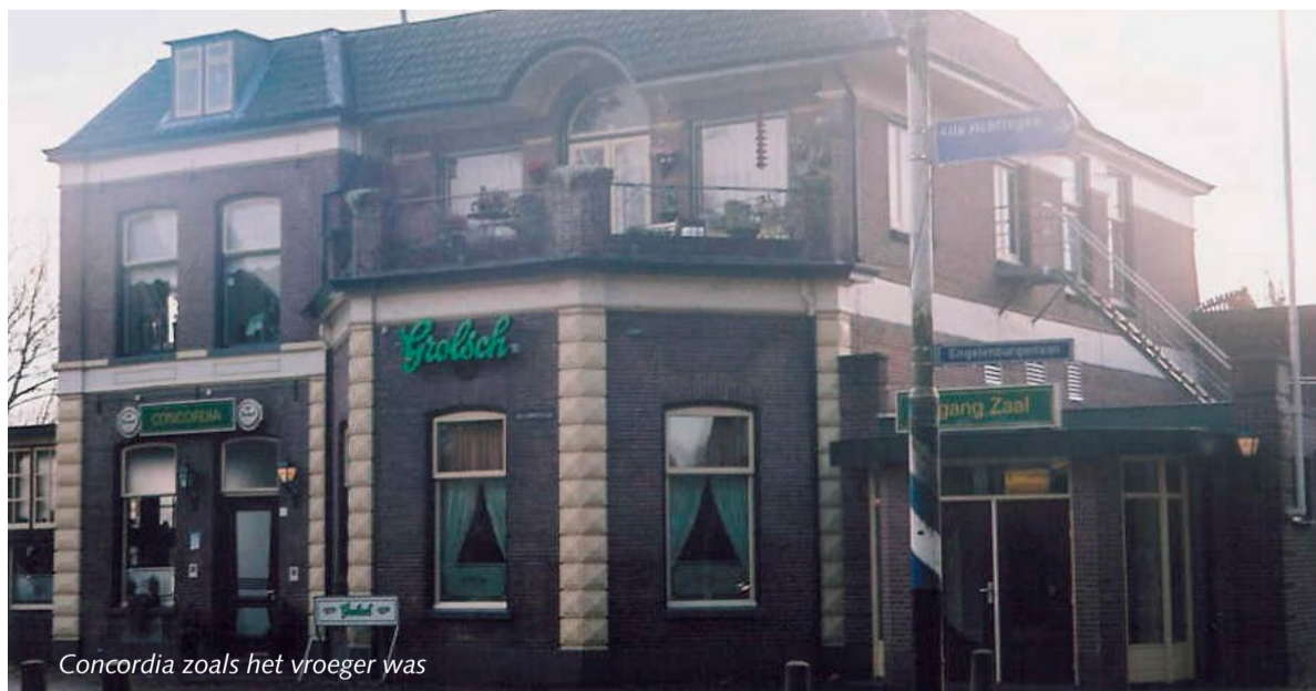
Concordia zoals het vroeger was

Inberg benadrukt het belang van de herontwikkeling: "Het is goed dat Concordia weer een horecafunctie krijgt. Voor het dorp is het een begrip, bijvoorbeeld tijdens de jaarlijkse kermis. Als college zien we ook de ontwikkeling van appartementen voor 1 en 2 persoons huishoudens als een goede. Want er is veel vraag naar dit type woningen."