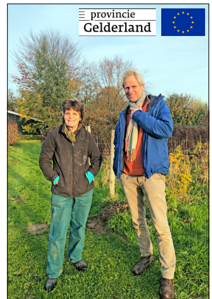
De Meander is een van de trekkers in het project Korte Voedselketens in Brummen. Dit project is tot stand gekomen met ondersteuning van de Provincie Gelderland en de Europese Unie in het kader van het Europees Landbouwfonds voor Plattelandsontwikkeling: Europa investeert in zijn platteland.

Ben je nieuwsgierig geworden? De Meander heeft een eigen winkel en idyllische plek die u kunt bezoeken in Brummen. Kijk hiervoor op demeanderbrummen.nl . Stichting het Anker is te vinden op: hetankerbrummen.nl