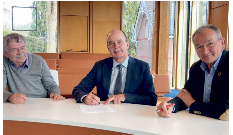
Burgemeester ondertekent samenwerkingsovereenkomst, onder toezicht oog van vertegenwoordigers van Nivon Natuurhuizen en ABK-huis.