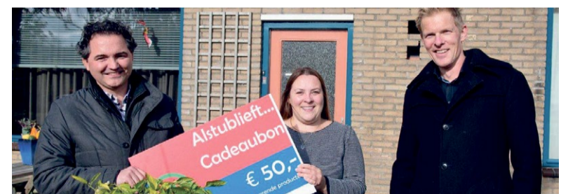
Uitreiking eerste cadeaubon aan huurder Veluwonen

De gratis cadeaubonnen voor koopwoningen zijn helaas allemaal al uitgegeven. Hiervoor is een