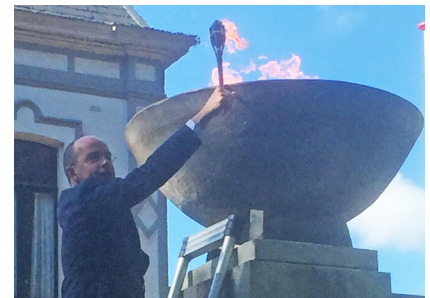
tival Brummen-Eerbeek. Iedereen kon vanuit huis via een livestream in totaal elf lokale muziekacts zien optreden.

Hoewel veel activiteiten die rondom de viering van 75 jaar vrijheid in onze gemeente de afgelopen weken niet konden plaatsvinden, heeft de burgemeester op dinsdagochtend 5 mei wel het bevrijdingsvuur ontstoken. Het vuur werd hem aangereikt door enkele inwoners die onderdeel uitmaken van een plaatselijke loopgroep. Na het ontsteken van het vuur bij het monument voor het gemeentehuis, opende Van Hedel ook het online Bevrijdingsfestival Brummen-Eerbeek. Iedereen kon vanuit huis via een livestream in totaal elf lokale muziekacts zien optreden.