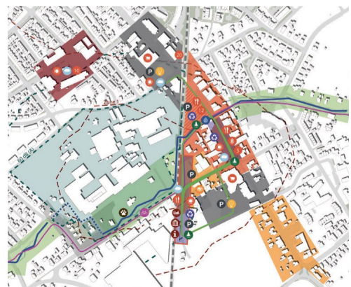
Schets van de plannen