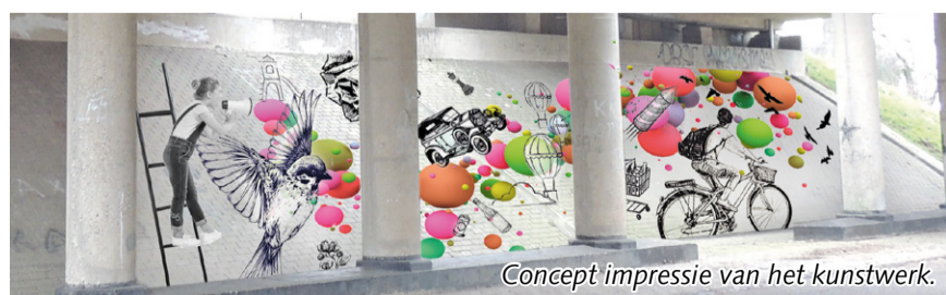
Concept impressie van het kunstwerk.

Burgemeester en wethouders staan positief tegenover het voorstel van Dorpsraad Brummen om muurschilderingen aan te brengen op het viaduct van de N348 bij de Cortenoeverseweg. Het viaduct is bezit van de provincie. Zowel provincie als gemeentebestuur juichen dit voorstel toe. Op verzoek van de provincie is de gemeente Brummen aanspreekpunt voor het uitvoeren van de schildering. Ook besloot het college dinsdag om het initiatief van de dorpsraad te ondersteunen met een bijdrage van 1500 euro. Gemeente en provincie zien het plan vooral als kans om deze toegangsweg naar het dorp