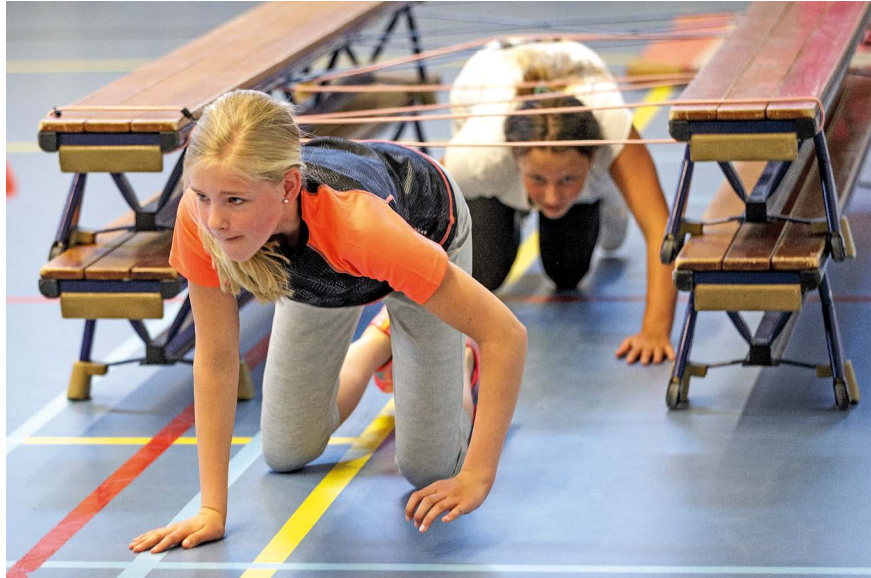
Stimuleren van sport en bewegen is een belangrijke taak van 'Sportkompas'

In de afgelopen periode is succesvol gestart met een organisatie die verantwoordelijk is voor het beheer van de binnensportaccommodaties en het stimuleren van sport, beweging en gezondheid in onze gemeente. Onder de naam Sportkompas heeft deze stichting met veel enthousiasme de nieuwe taken opgepakt en in korte tijd een uitstekende basis gelegd. Gelet op de eerste ervaringen gaan gemeente en Sportkompas nu concrete stappen zetten om deze basis verder te verstevigen, toekomstbestendig te maken en vooral ook kansen voor de lokale sport en recreatie benutten door de krachten te bundelen in een nieuwe organisatie, een 'sportbedrijf'.