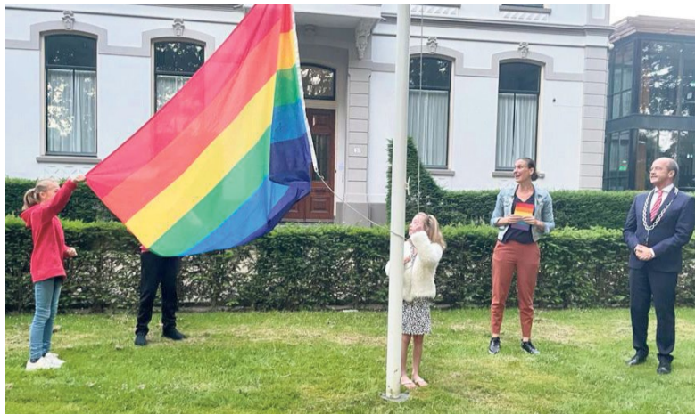
Een unaniem besluit van de raad: op 27 juni werd de regenboogvlag gehesen.

De raad stemde in met een investeringskrediet voor de aanleg zonnepanelen op sporthal De Bhoele. Ook schaarde de raad zich achter diverse ruimtelijke en planologische voorstellen. Zo was er steun voor het bestemmingsplan voor het Wilhelminapark/Palسيوم-park. Ook kwam er akkoord voor de coördinatie-regeling voor het