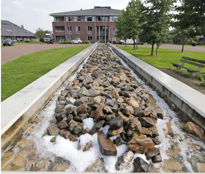
Inwoners vinden het prettig wonen in de gemeente Brummen. Op de foto de locatie Buiten de Veste in Brummen.

Het is prettig wonen in onze gemeente, zo blijkt uit het laatste onderzoek onder het inwonerspanel Brummen Spreekt. De ondervraagden geven voor het woongenot in hun buurt een gemiddelde beoordeling van 7,9. Velen voelen zich thuis in de buurt (88%) en vrijwel eenzelfde percentage (87%) zien we bij de vraag of men zich altijd of meestal veilig voelt in de woonomgeving. Het zijn enkele aansprekende resultaten uit het onderzoek waarbij wonen, leefomgeving en het contact met de gemeente centraal stond.