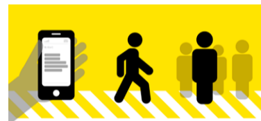
Lees bericht >> kom in actie >> help anderen

NL-Alert wordt steeds vaker ingezet bij noodsituaties. Zo zijn vorig jaar in heel Nederland 174 NL-Alerts uitgezonden. In 2013 waren dit er nog 33. Dit is een goede ontwikkeling; ook Gelderlanders worden bij steeds meer noodsituaties op hun mobiel gewaarschuwd en geïnformeerd. Denk bijvoorbeeld aan een grote brand, terroristische aanslag of onverwacht noodweer.