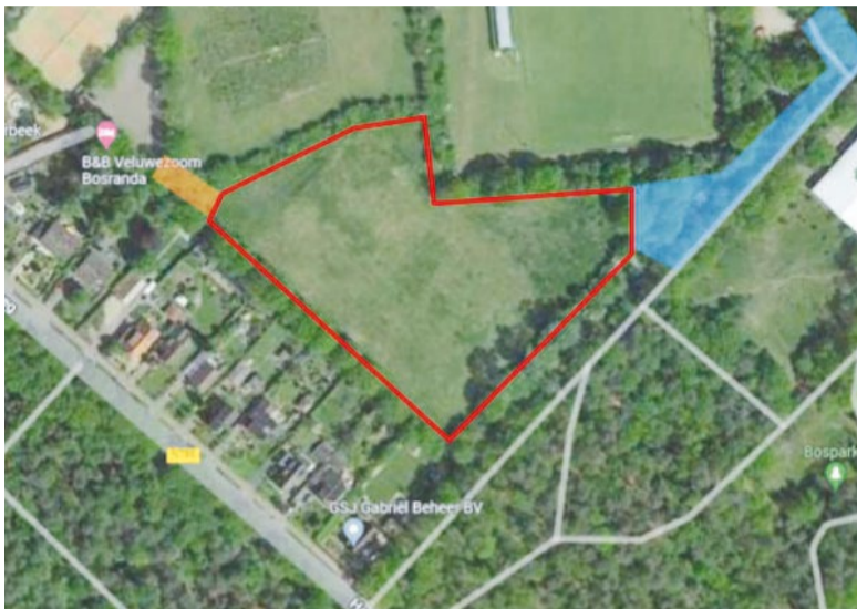
Het terrein waar de tijdelijke woningen gebouwd gaan worden.

Er komen naar verwachting 48 tijdelijke woningen op het oude trainingsveld naast sportpark De Veldkant in Eerbeek. Met dit voorstel biedt het college de ontheemden uit Oekraïne een passend onderkomen. In april 2023 eindigt de opvang van de ongeveer 50 Oekraïners die nu nog in het ABK-huis in Hall wonen. Met de bouw van de tijdelijke woningen levert de gemeente ook een extra bijdrage aan het tegengaan van het nijpende tekort aan woningen.