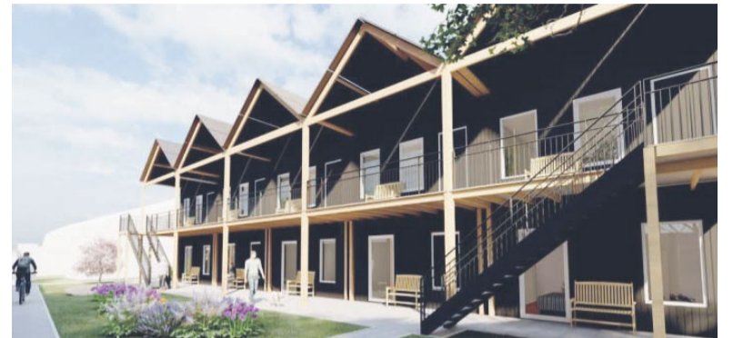
Sfeerbeeld van de mogelijk te plaatsen tijdelijke woningen.