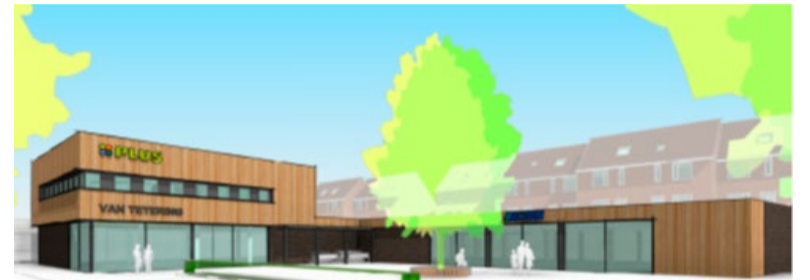
Voorlopig ontwerp Plus en Action (vanaf De Wasacker)

Op zaterdagmiddag 15 januari 2022 jaar vindt er een inloophijeenkomst plaats. Centraal hierbij staan de ontwikkeling van het winkelcomplex aan de Stuijvenburchstraat en De Wasacker in Eerbeek en de herinrichting van de openbare ruimte bij De Wasacker. De bijeenkomst vindt plaats tussen 13.00 en 16.00 uur in een leegstaande winkel aan de Coldenhovenseweg. Belangstellenden moeten zich vooraf aanmelden, zodat een planning gemaakt kan worden om de inloophijeenkomst verantwoord binnen de geldende coronaregels te kunnen organiseren.