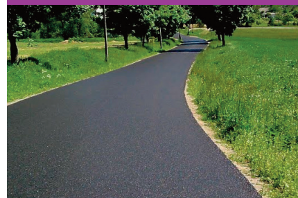
KLEIN ONDERHOUD ASFALT