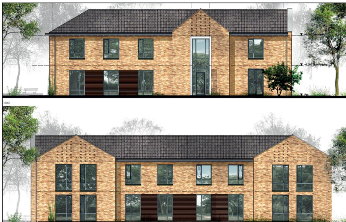
Afbeelding 2.2 Gevelaanzichten gewenste woonzorgvoorziening (Bron: Weusten Liedenbaum architecten)