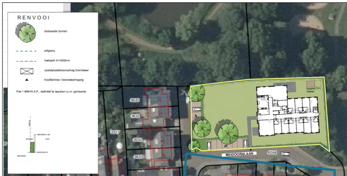
Afbeelding 2.1 Inrichtingstekening nieuwe situatie projectgebied

Een situatietekening van de gewenste situatie is in afbeelding 2.1 opgenomen. Het projectgebied is hierop aangeduid met een gele omlijning. In afbeelding 2.2 zijn de gevelaanzichten van de beoogde bebouwing weergegeven.