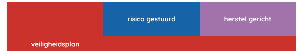
Figuur 3 Gefaseerde ketenzorg volgens Vogtlander & Van Arum

Vervolgens nemen we maatregelen om op de lange termijn slachtoffers te beschermen en het risico op huiselijk geweld te vermijden, te verminderen en te voorkomen. Daarmee werken we aan de stabiele veiligheid. Ook hierbij moet de veiligheid continu gemonitord worden. Het veiligheidsplan is de rode draad bij al het handelen van de professionals. Alle schakels in de keten werken in elke fase van gefaseerde ketenzorg samen. We sluiten hiermee aan bij de visie Gefaseerde ketenzorg van Vogtlander & Van Arum (2016).