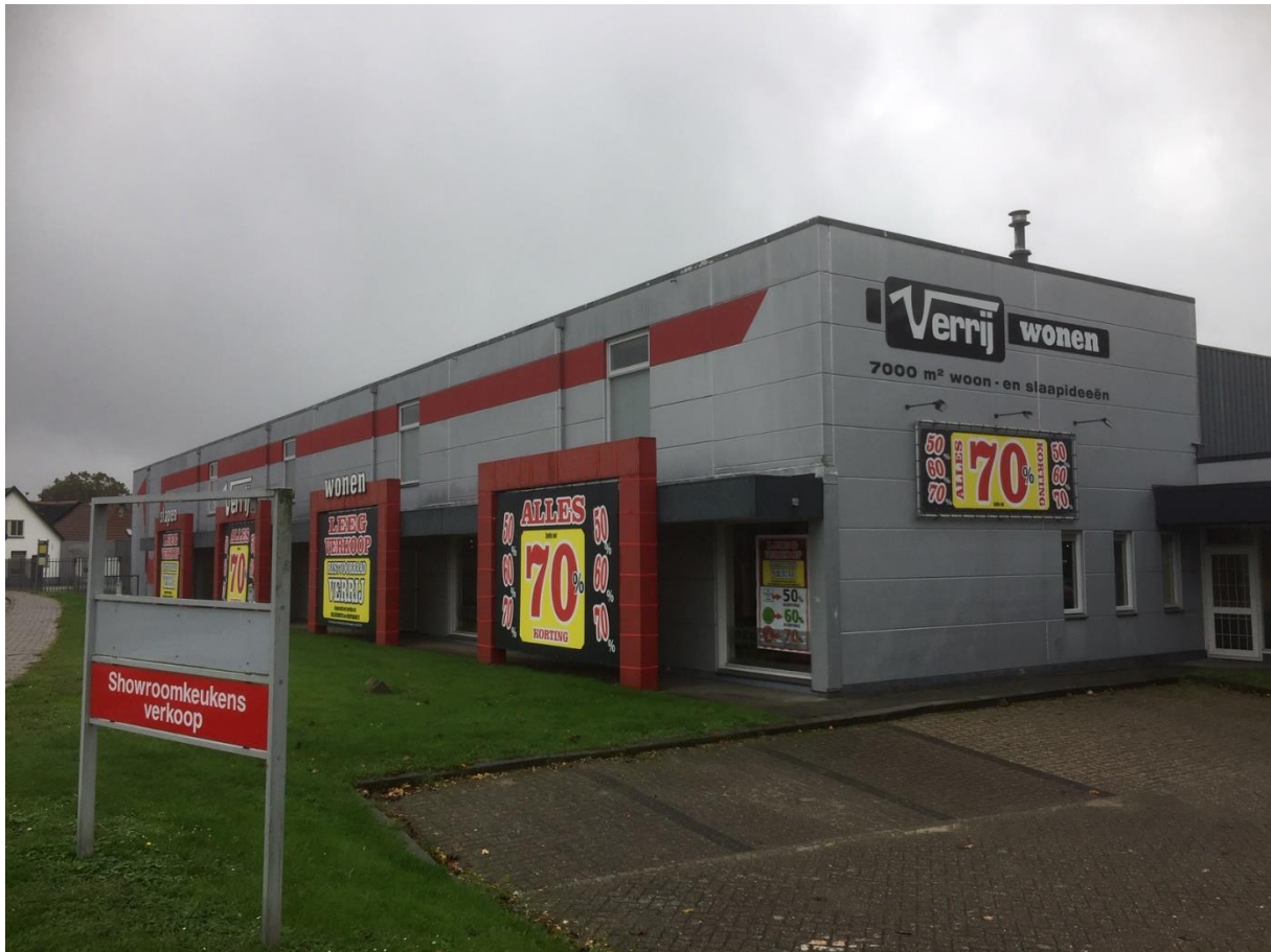
Figuur 3. Aspect van de te slopen meubelhal.

Aldi is voornemens om de meubelhal te laten slopen en vervolgens daar een nieuwe winkel te bouwen.