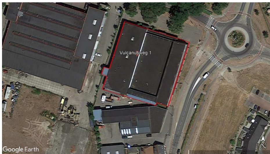
Figuur 2. Luchtfoto van de te slopen meubelhal (rood omlijnd).

De planlocatie is een meubelhal (van twee verdiepingen) met een oppervlakte van circa 3000 m 2 op het adres Vulcanusweg 1 te Brummen (figuur 2). Het gebouw heeft een plat dak (figuur 3).