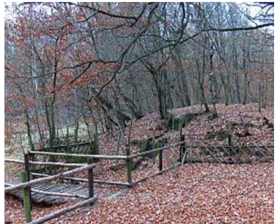
Afbeelding 19: Foto uit 2003 van de locatie Kerstensmolentje met de waterval, waar vroeger het waterrad draaide. Links ter plaatse van het weiland stond de Molen.