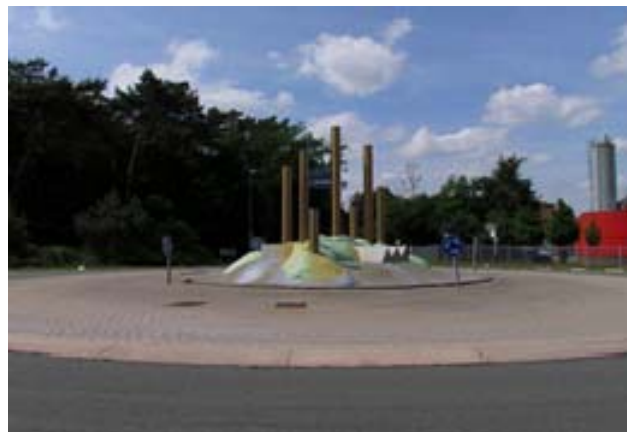
Afbeelding 21: Kunstwerk van aluminium, refererend aan papierindustrie, rotonde Harderwijkerweg – Coldenhovenseweg