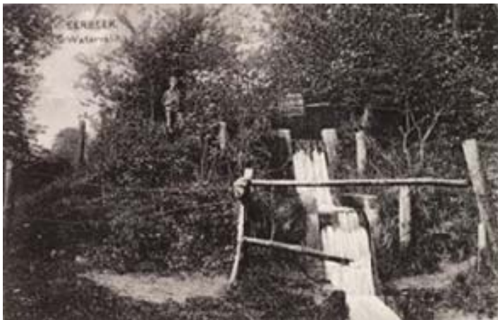
Afbeelding 18: Historische opname van de waterval van het Kerstens Molentje

Hieraan herinneren nog de nu droogstaande opgeleide bovenbeek, een ruïne van een waterval opgebouwd uit twee boven elkaar liggende gedeelten en een iepen-opslag. De iep was voor molenaars een belangrijke boom. Het hout werd gebruikt voor molengoten en assen van molenraderen.