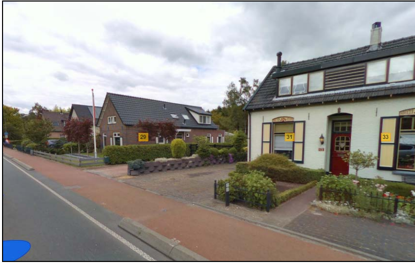
Afbeelding 11: Lint Harderwijkerweg