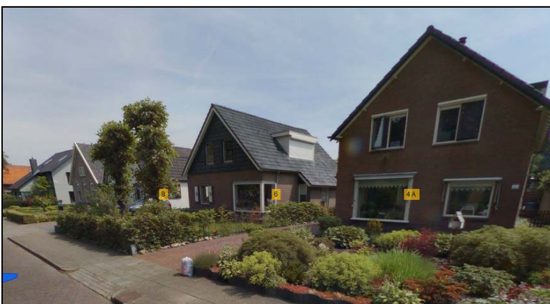
Afbeelding 10: Lint Molenstraat