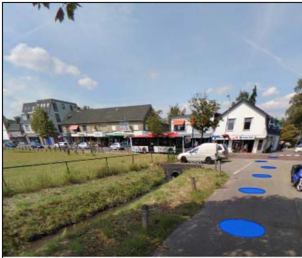
Afbeelding 7: Eerbeekse Beek ter hoogte van het Beekpad