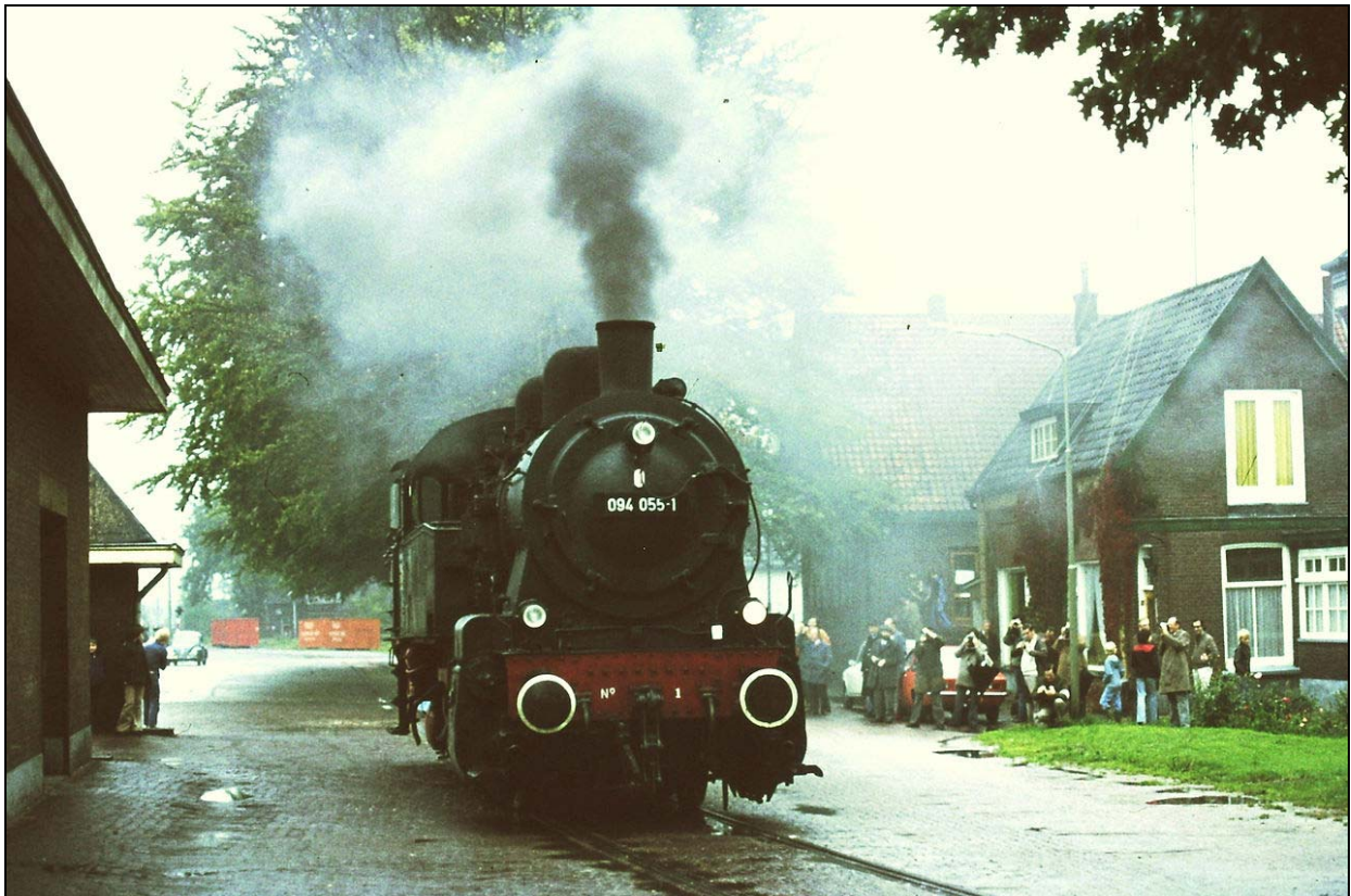
Afbeelding 12: Stoomlocomotief DB 094 055 van de VSM in 1975