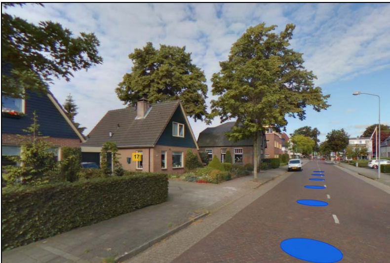
Afbeelding 9: Lint Stuijvenburchstraat

Onder andere de as Loenenseweg – Stuijvenburchstraat, de Coldenhovenseweg, de Loubergweg, 't Hungeling, Boerenstraat, Smeestraat, Harderwijkerweg en een deel van de Ringlaan maken onderdeel uit van de lintenstructuur. Door de komst van de papierindustrie is een deel hiervan, zoals langs de Loubergweg en Coldenhovenseweg, zeer verdicht, met woningen uit allerlei perioden, maar ook met bedrijfsbebouwing, bedrijfswoningen en enkele villa's van de vroegere fabrieksdirecteuren.