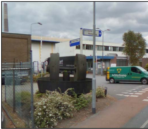
Afbeelding 20: Lopers uit de Kollergang