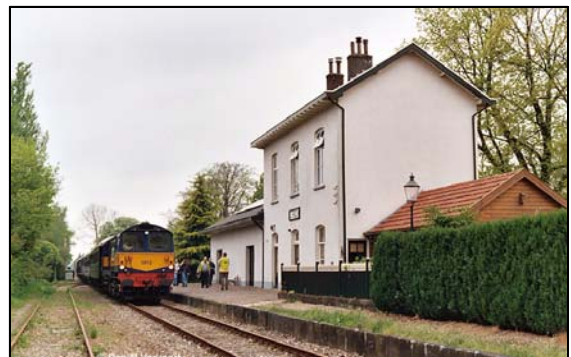
Afbeelding 15: Station Eerbeek