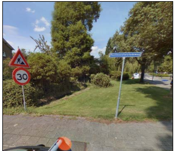
Afbeelding 8: Eerbeekse Beek ter hoogte van de Smeestraat

Op de linker beekoever staat een hoog bakstenen gebouw, dat inwendig verbouwd is tot woonhuis. Bij de inrit liggen stenen uit de Kollergang. Er is een meetstuw van het waterschap, die de plaats inneemt van de voormalige waterval. Vanaf hier heet de beek Voorstondense Beek. Verderop is de beek gebruikt ten behoeve van de waterpartijen van Huis Voorstonden. De waterpartijen liggen op verschillende niveaus. De Voorstondense Beek eindigt als Hoendernestbeek in de IJssel. Op dit beekdeel komen ook nog uit de Tondense beek, de Emperbeek en de beek over het Hontsveld.