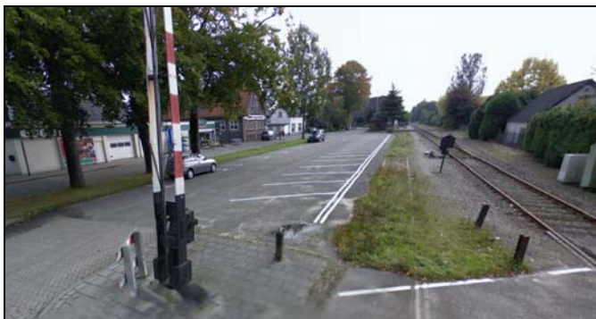
Afbeelding 14: Stationslocatie ter hoogte van de Coldenhovenseweg

De spoorlijn loopt dwars door het centrum van Eerbeek. In Eerbeek staat nog het voormalig spoorwegstationsgebouw van de KNLS 3e klasse, gebouwd in 1886. In paragraaf 4.2 Cultuurhistorische puntelementen wordt hier nader op ingegaan. Het is momenteel in gebruik als woning. Aan de noordzijde van de spoorlijn liggen de Burgerslocatie, de stationslocatie en het Kerstensterrein. Het spoor loopt dwars door het centrum en scheidt de Loenenseweg van de Stuijvenburchstraat, waardoor het winkellint in tweeën wordt gesplitst. Het spoor vormt ook een duidelijke barrière tussen het winkelgebied aan de Stuijvenburchstraat en de (papier) industrie aan de zuidzijde. In Eerbeek heeft het station door zijn solitaire ligging en de dienstregeling van de VSM geen verbinding met de rest van het centrum of dagactiviteiten.