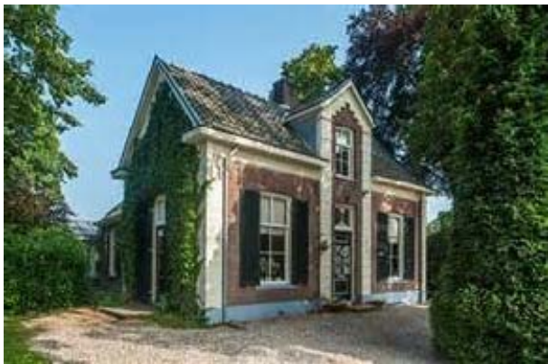
Molenstraat 3 te Eerbeek Functie: woonhuis Bouwjaar: 1902 Status: gemeentelijk monument Waardering: midden kwaliteit

Vrijstaand huis welke in 1902 is gebouwd als onderwijzerswoning. Het woonhuis is goed bewaard gebleven en een mooi voorbeeld van een dwashuistype met achterhuis van begin deze eeuw. Qua situering is de woning mooi gelegen, bepalend in het straatbeeld omgeven door een grote tuin met onder andere eiken en beuken.