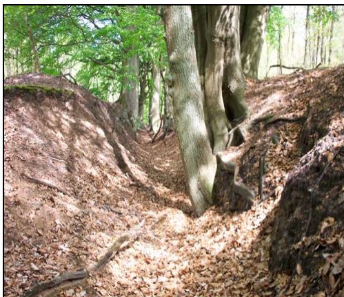
Afbeelding 3: Droogstaande Gravinnebeek

De Eerbeekse Beek stroomt van zuidwest naar noordoost dwars door het centrum van Eerbeek en bevat kwalitatief goed water. De Eerbeekse Beek is van oorsprong een natuurlijke beek. De bovenloop, de Coldenhovense Beek, is voor een belangrijk deel gegraven. De meeste sprengkoppen zijn gegraven rond 1665, als er meer water door de beek stroomde konden er meer molens worden aangedreven. De Eerbeekse Beek ontvangt zijn water uit twee sprengensystemen. Het meest noordelijke stelsel wordt wel aangeduid als de Gravinnebeek. Dit stelsel staat momenteel nagenoeg droog. De Gravinnebeek mondt ter hoogte van de Harderwijkerweg uit in de Eerbeekse Beek. Het andere stelsel heeft vijf sprengkoppen waarvan alleen de twee meest westelijke water leveren.