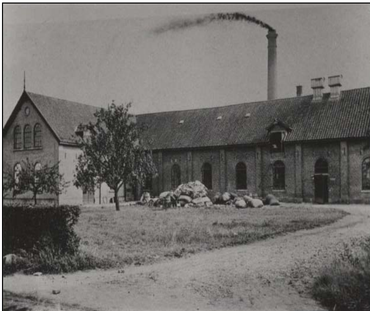
Afbeelding 21: Papierfabriek het Klooster (later Verenigde Papierfabrieken) – datum onbekend

Op de oude molenplaats staat nu het fabriekscomplex van Mayr-Melnhof.