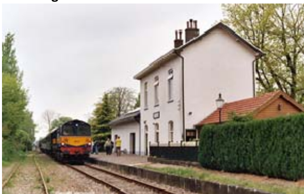
Stationstraat 2 te Eerbeek Functie: stationsgebouw/woonhuis Bouwjaar: 1886 Status: gemeentelijk monument Waardering: midden kwaliteit

Stationsgebouw uit 1886 van de voormalige Hollandse IJzeren Spoorwegmaatschappij. Het betreft een eenvoudig gebouw waar in 1905 een verdieping werd gebouwd, welke is afgedekt met een zadeldak. Het gebouw is van eenvoudige architectuur, maar kenmerkend voor de tijd van het ontstaan, alsmede voor de ontwikkeling en de geschiedenis van de spoorwegen in de provincie Gelderland.