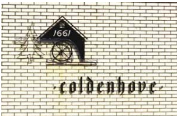
Afbeelding 17: Bedrijfsvignet papierfabriek Coldenhove

Tegenwoordig herinnert alleen het bedrijfsvignet, waarop een kleine bovenslagmolen is afgebeeld, nog aan vroeger tijden. De Bovenste Molen prijkt niet alleen op het nieuwe kantoorgebouw, maar ook op het bedrijfspapier en op de auto's van de fabriek.