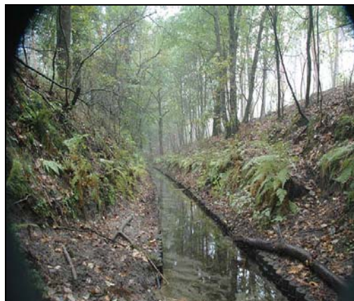
Afbeelding 4: Coldenhovense Beek