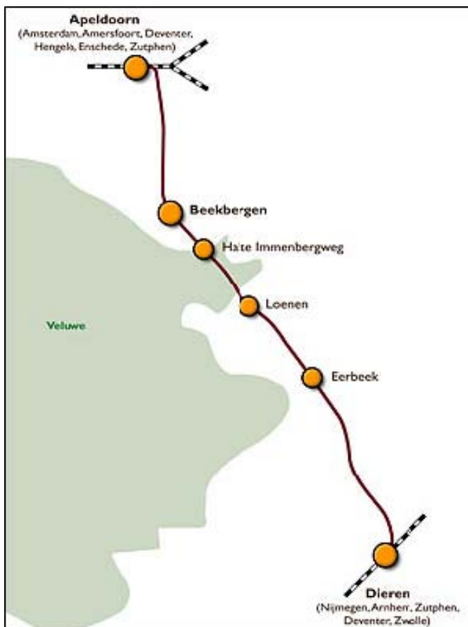
Afbeelding 13: Traject VSM