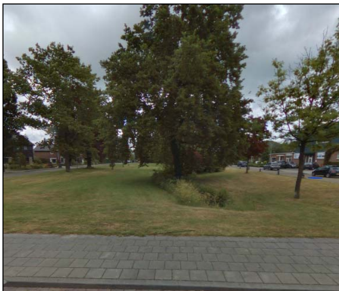
Afbeelding 5: Eerbeekse Beek ter hoogte van DS Smith Afbeelding 6: Eerbeekse Beek ter hoogte van 't Haagje

Vervolgens loopt de Eerbeekse Beek door een groenstrook langs 't Haagje tot aan het terrein van Mayr-Melnhof. De Eerbeekse Beek loopt daarna langs de tuinen van de papierfabriek naar de spoorlijn, waar het via het Beekpad de Stuijvenburchstraat kruist. Zowel op het terrein van Mayr-Melnhof, als langs het Beekpad en het kruisen van de Stuijvenburchstraat heeft de Eerbeekse Beek een marginale rol.