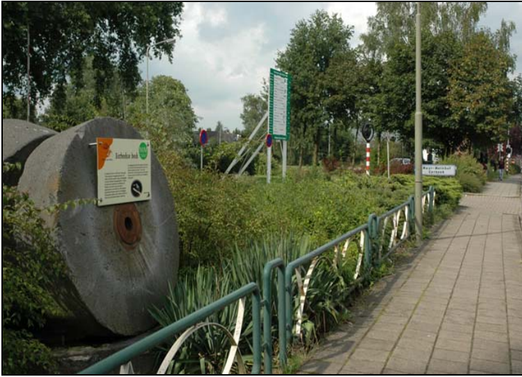
Afbeelding 22: Entree Mayr-Melnhof met kollergang