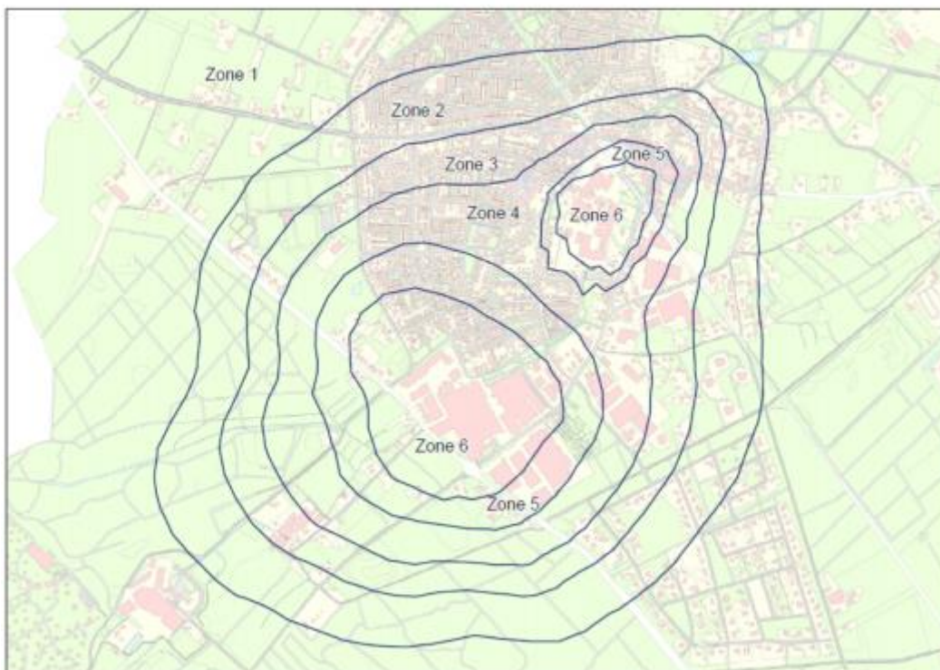
Figuur 1: onderzoekzones TLO

In onderstaande figuur is een kaart weergegeven van het onderzoeksgebied. Op de kaart zijn op basis van de gecumuleerde vergunde geurcontouren van de papierindustrie in Eerbeek (Mayr-Melnhof en DS Smith) 6 zones weergegeven met een oplopende vergunde geurbelasting.