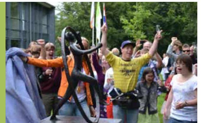
Oplevering van de studentenhuysvesting bij Spelderholt.