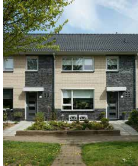
Renovatie van doorzonwoningen in Brummen. Sinds 2015 hebben deze woningen een A-label.