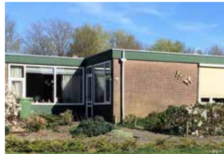
In 2017 renoveren wij deze woningen aan de Vlinderstraat in Beekbergen naar ‘all electric’-woningen

“Het is straks normaal dat een huis evenveel energie opwekt als de bewoners verbruiken.”