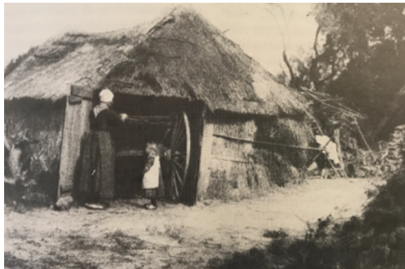
Rond 1900 stond aan de Hallse dijk deze plaggenhut

“Onvoorstelbaar hoeveel er in korte tijd veranderd is”