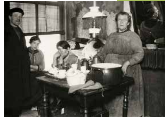
Wonen begin 20ste eeuw.