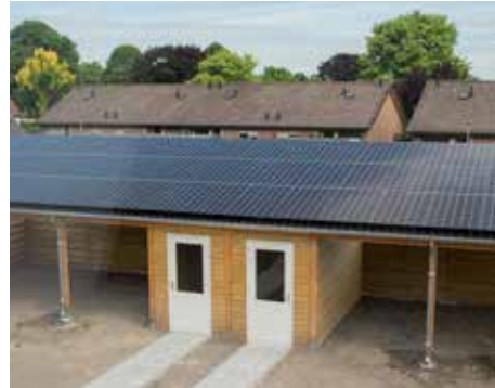
Schuur met zonnepanelen op het dak bij de NOM-woningen

De vier oudste huizen in de Eerbeekse Enk, inclusief eerste steen! In 2017 renoveerden we deze huizen naar nul-op-de-meter-woningen.